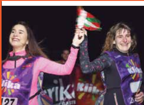
Seme-alaba euskaldun eleantzak